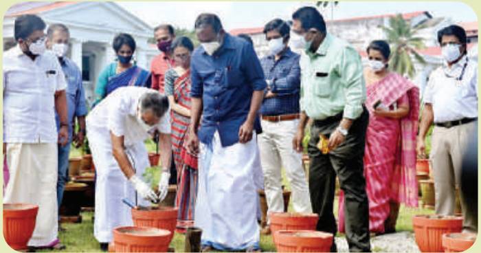
Onathinu Orumuram Pachakkari Inauguration