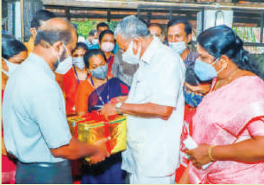
Inauguration of Foot and Mouth Disease Vaccination under National Animal Disease control program II Phase