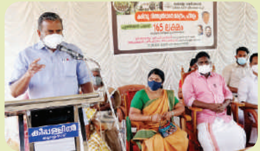
Punarjani at Pandalam Farm