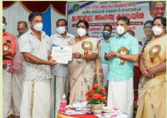
Kerala Dairy Farmers Welfare Fund Membership Campaign Inauguration at Chadayamangalam