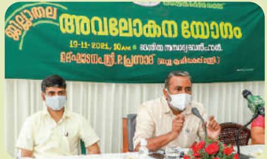
District level Avalokana Yogam