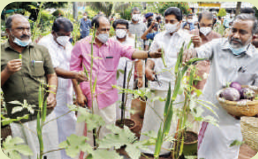
Onathinu Orumuram Pachakkari Harvest