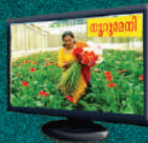
Noorumeni Video Documentary Doordarsan (Mal) Sunday 9.30 AM Kairali News Channel (Mal) Sunday 3.30 PM