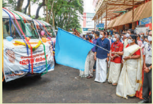
Inauguration of Ambulatory service in Animal Husbandry Department