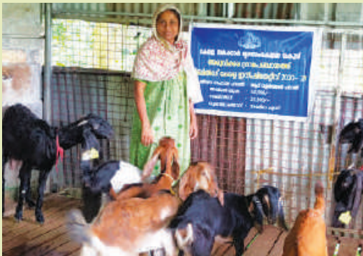
RKI Goat rearing scheme