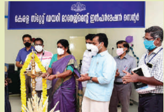
Kerala State Dairy Management Centre Inauguration