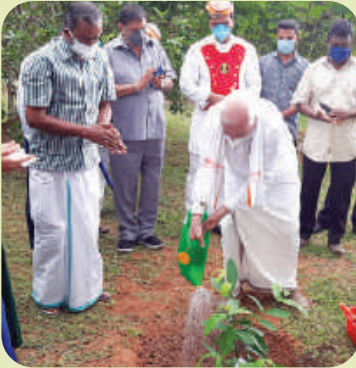
One crore fruit plant Inauguration