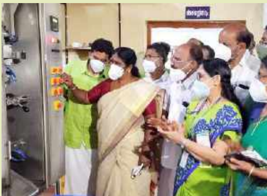
Dairy plant Inauguration at Ancharakkandy, Kannur