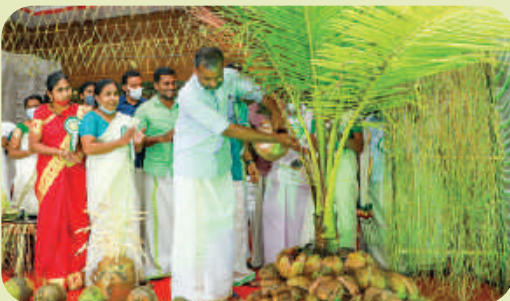
Keragramam Inauguration at Kanjikkuzhi, Alappuzha