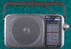
Farm News All India Radio 7.05 AM Daily